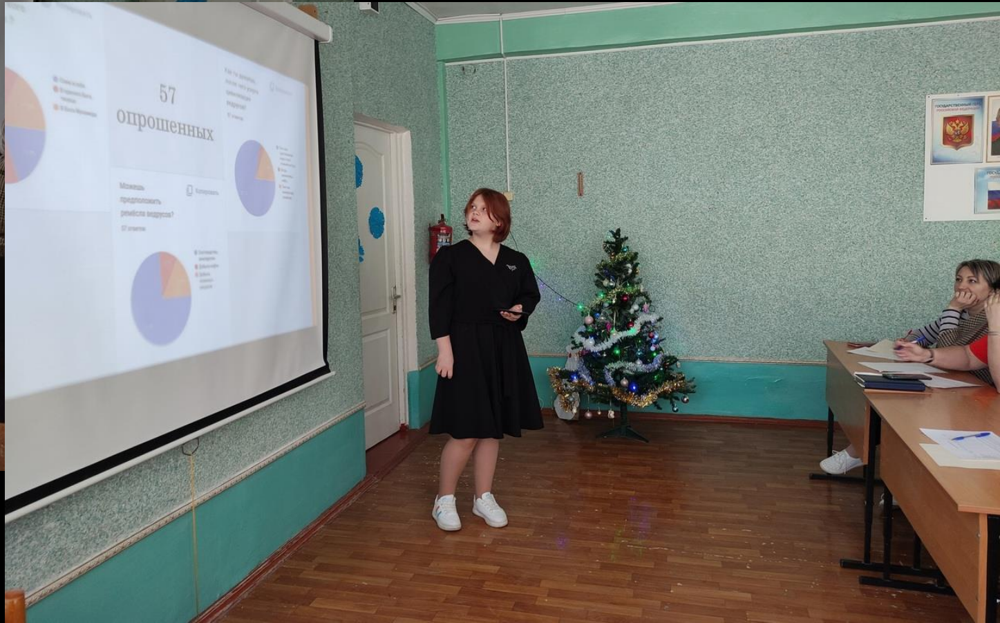
Учит новым методам сбора информации и работе с ЦОР