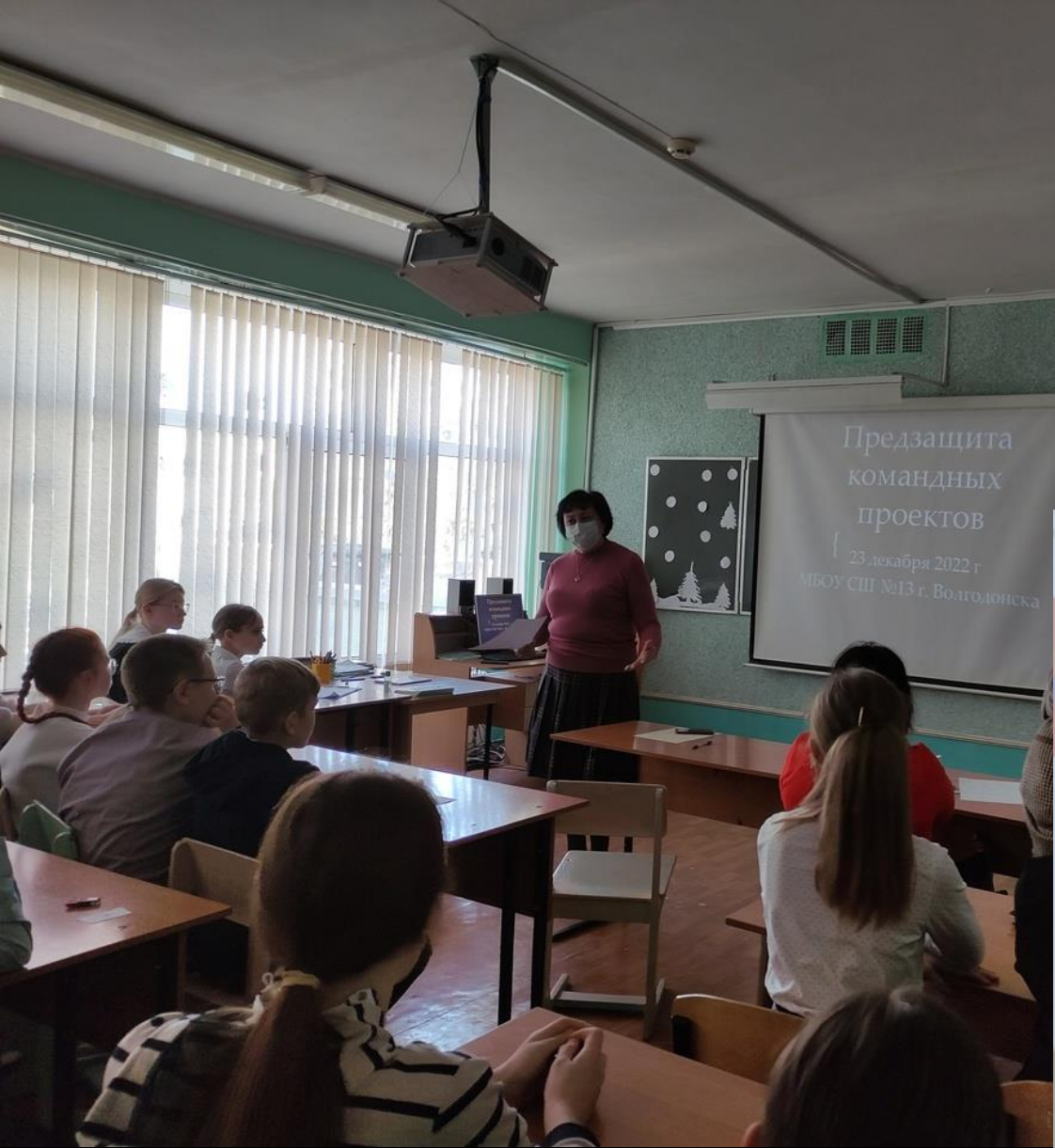
Учит осмысливать значимость поисковой работы и побуждает к новым исследованиям тем